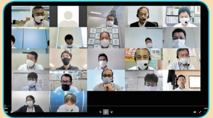
協議会の様子（Zoom画面）